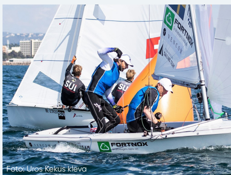
klēva

en mixedklass, så handlar det totalt om tio grenar/klasser där man tävlar om medaljer. Och för första gången i den olympiska historien är seglingen helt jämställd med lika många aktiva damer som herrar.