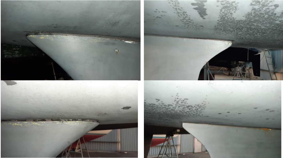
Oskadad kölinfästning där sikaflexskarven gör att färgen flagnar av

Inspektera kölinfästningen utvändigt. Var speciellt uppmärksam på sprickor som går diagonalt från kölens fram- och akterkant. Dokumentera med fyra foton enligt exemplet nedan.