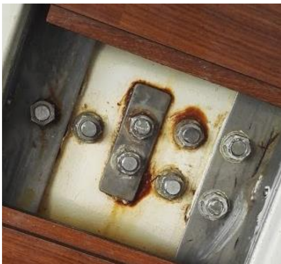
Kölbultar med misstänkt korrosion

Inspektera kölbultar och brickor. Var speciellt uppmärksam på tecken på korrosion (tex. rost-färgad missfärgning i plasten runt bultar och brickor. Känn efter att bultarna är åtdragna med en fast nyckel eller ett vanligt spärrhandtag. Bultarna skall kännas stumma. Är bultarna lösa behöver de dras åt till korrekt åtdragningsmoment. Detta innebär en risk att förstöra bultarna. Gör inte detta moment själv om du inte känner till korrekt åtdragningsmoment och korrekt procedur för att genomföra arbetet.