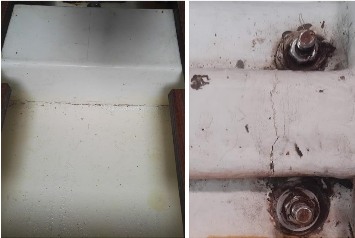
Bottenstockar med misstänkta skador

Inspektera bottenstockar och balkar för tecken på sprickor eller rörelse. Var speciellt uppmärksam på ställen där balkar slutar eller ansluter till annan struktur, tex. kojfronter. Titta på kojfonternas insida under kojerna.