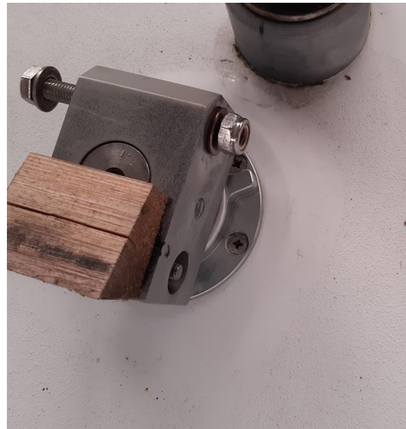
Övre roderlager, inga skador