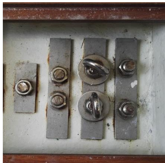
Kölbultar utan spår av korrosion