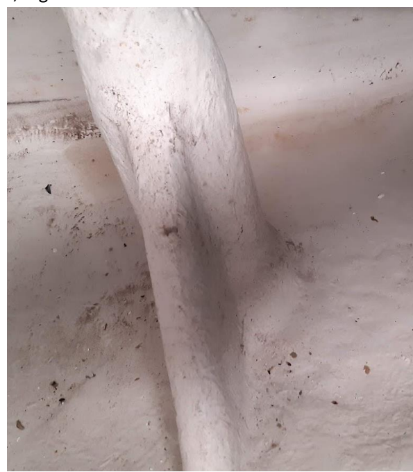
Insidan vid nedre roderlager, inga skador