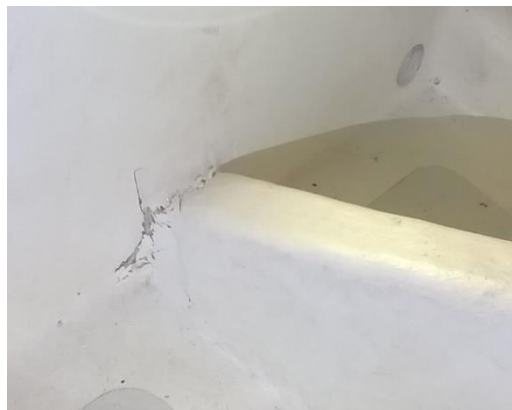
Bottenstock-kojfront efter grundsstötning